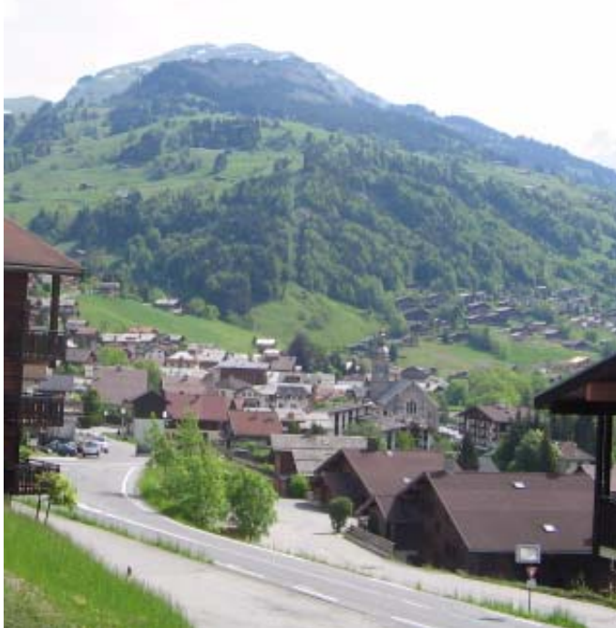
Uitzicht op het dorp vanaf Fougère

Voor de wandelaars zijn er verschillende routes uitgezet zonder of met raquettes welke laatste sport hier veelvuldig beoefend wordt.