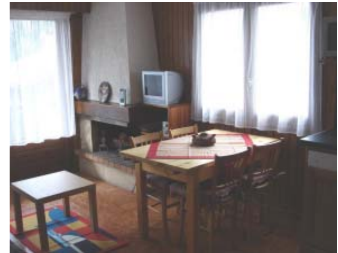
De woonkamer met open haard

In deze schitterende omgeving verhuren wij ons appartement in het centrum van het dorp, met uitzicht op de pistes en het dorpscentrum; de bakker is slechts 300 meter. Het heeft plaats voor totaal 4 personen .