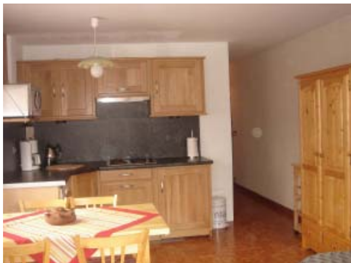
keuken met eethoek