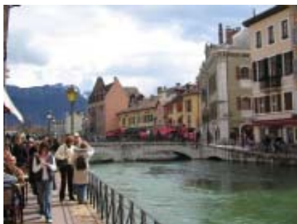
Binnenstad van Annecy met zijn kanalen

Ook Zwitserland is niet ver. Genève is slechts 45 km. En via de tunnel van de Mont-Blanc (50km) is men snel in Italië.